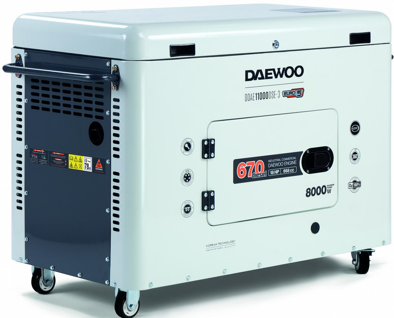
Daewoo Diesel DDAE 11000DSE-3 Dual Power 230V/400V, cichy: 56dB, moc: 8,0/7,5kW

https://daewoo-power.com/pl/support/garantiya/