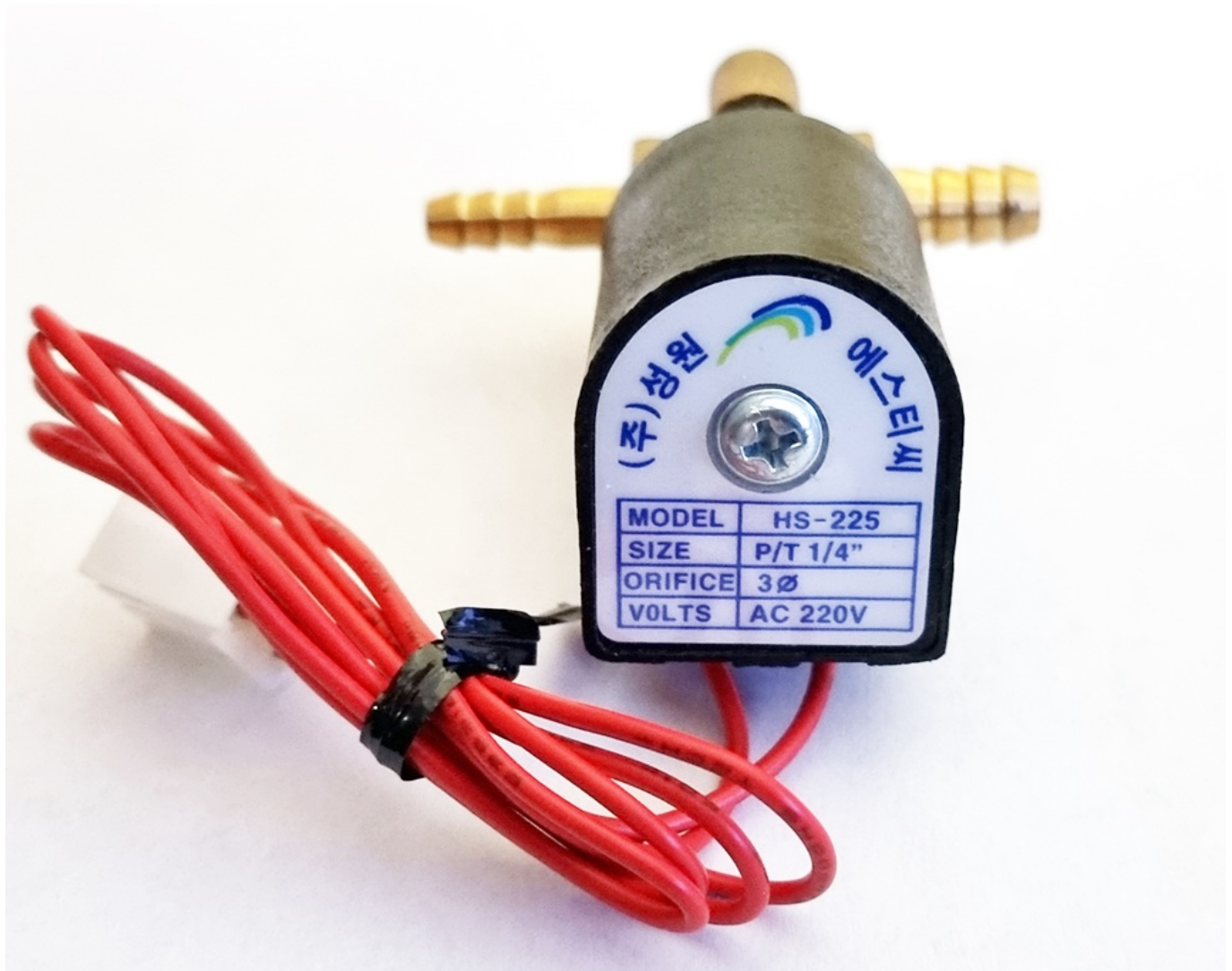
Oryginalny i kompletny elektrozawór ang. solenoid valve do nagrzewnic olejowych XARAM Energy / Tiger King seria TK-55, TK-60 i ZF-60.