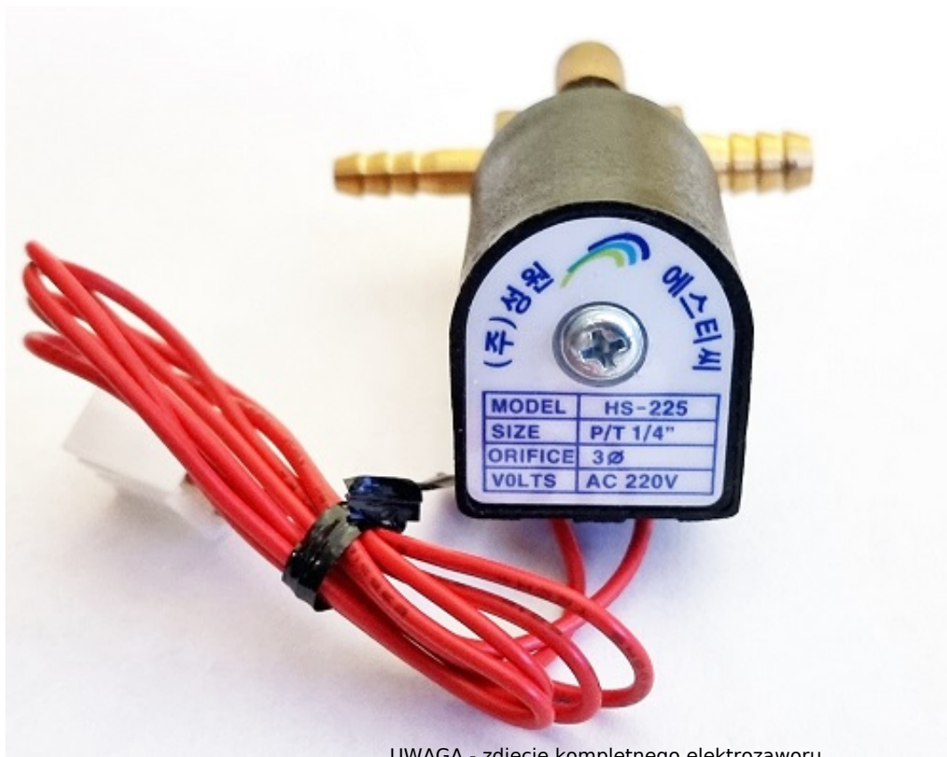
UWAGA - zdjęcie kompletnego elektrozaworu

SCHEMAT, KODY I CENY WSZYSTKICH CZĘŚCI ZAMIENNYCH DO NAGRZEWNIC OLEJOWYCH XARAM Energy seria TK-ID znajdziesz tutaj: