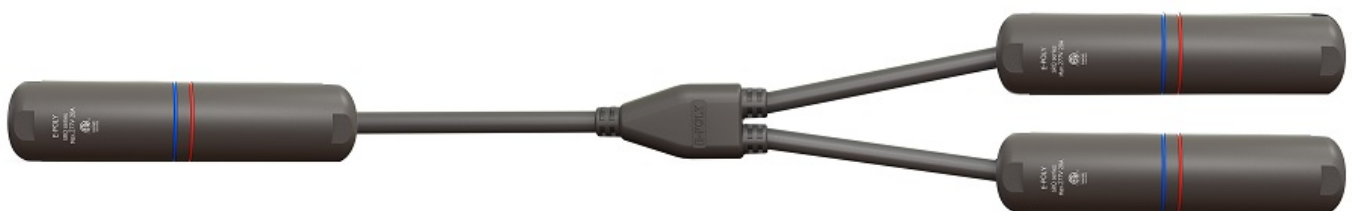
Szybkozłącze hermetyczne SRQ-HT

Najnowocześniejsza technologia sprawia, że w kilka minut może być całkowicie hermetyczne, wodoodporne połączenie dwóch odcinków samoregulującego kabla grzewczego z zasilaniem 230V przy pomocy dodatkowej hermetycznej szybkozłączki ! Zestaw składający się z dwóch szybkozłączek hermetycznych SRQ-HT :