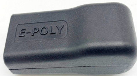
Szybkozłącze hermetyczne SRQ-ES

wraz z dwoma końcówkami kabla w postaci hermetycznych końcówek SRQ-ES z klipsami wewnątrz i z uszczelniającym żelom krzemionkowym ( SRQ-ES nadaje się tylko do ogrzewania kabla o grubości 5,5 ~ 7 mm).