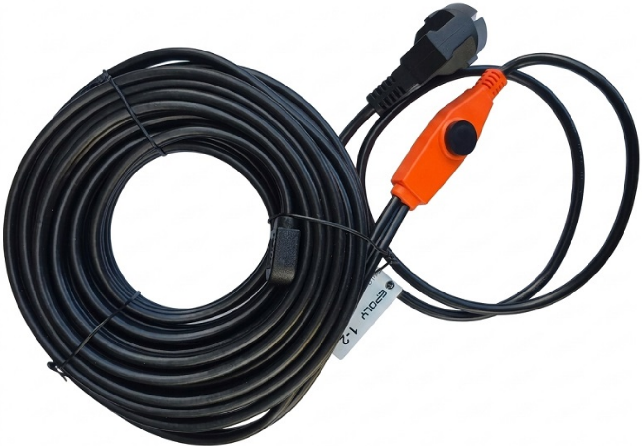
Poglądowe zdjęcie - EPOLY PFP=12mb

Zapraszamy firmy instalacyjne, firmy budowlane, sklepy i hurtownie do stałej współpracy.