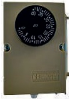
TERMOSTAT Z KAPILARĄ ZAKRES PRACY 0st.C - 40st.C